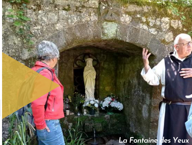
La Fontaine des Yeux