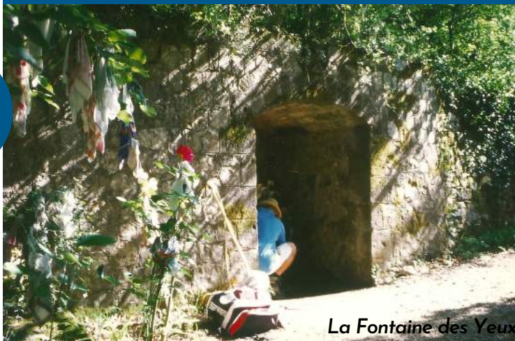
La Fontaine des Yeux