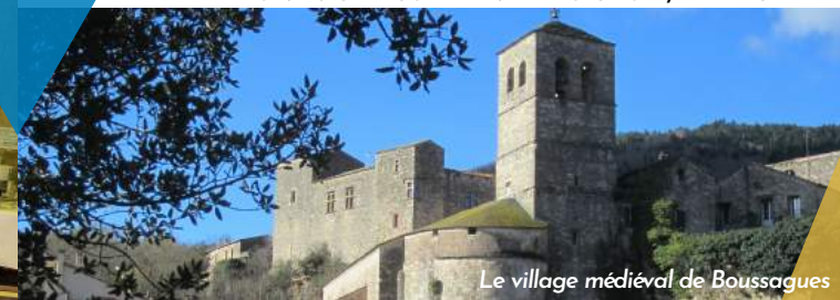
Le village médiéval de Bousagues

UNE VISITE COMMENTÉE AU CHOIX, L'APRÈS MIDI