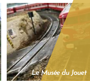
Le Musée du Jouet