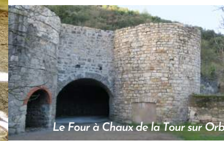
Le Four à Chaux de la Tour sur Orb